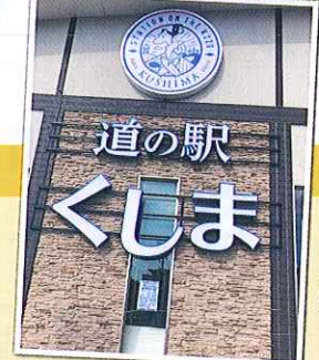
道の駅くしまのメイン看板