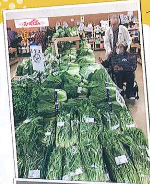
宮崎の直売所は野菜が豊富

直売所運営者、生産者、JAや自治体の担当者…関係する多くの皆さんの参加をお待ちしています。