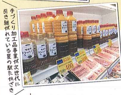
手づくり加工品事業が次世代に引き継がれている星の駅たかざき